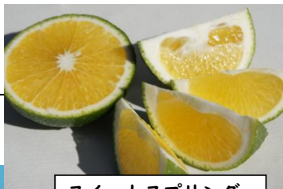
スイートスプリング