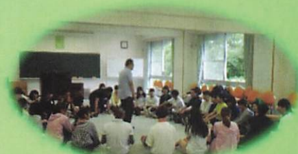
レクリエーション指導の様子