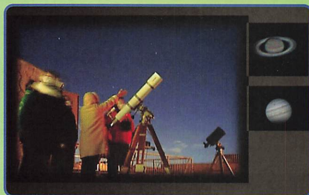
望遠鏡で土星を見ると感動します!