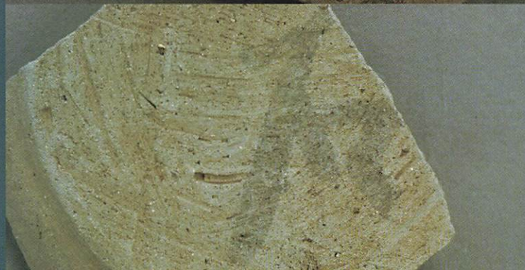
いずれも鳥ノ上遺跡出土墨書土器(部分)