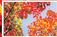
お昼の紅葉もおおすすめです!